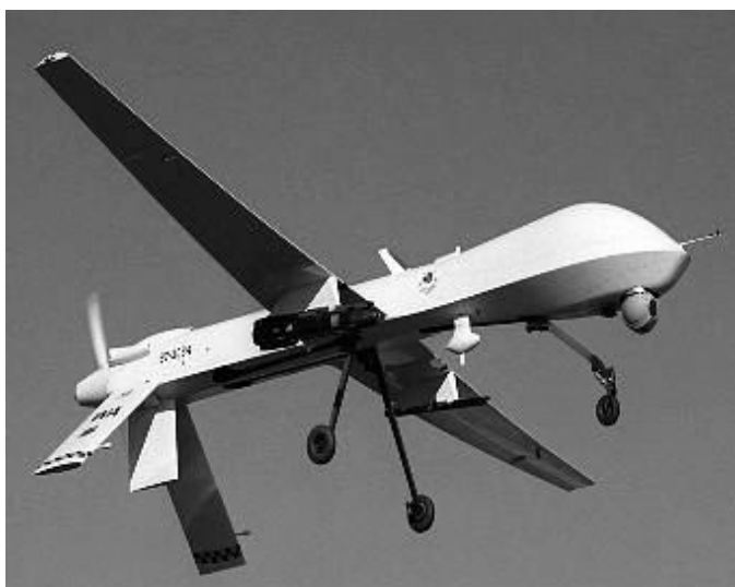
De MQ-1 Predator; een onbemand op afstand bestuurd spionagevliegtuig dat ook Hellfire raketten kan afvuren.

lig is en slimme mensen het leiden’, vertelde de voormalige vooraanstaande veiligheidsfunctionaris mij. ‘Het wordt uitgevoerd door professionals. De N.S.A., de CIA en de D.I.A. - de veiligheidsdienst van Defensie – zijn daar ter plaatse met de Special Forces en Pakistaanse veiligheidsdienst en ze hebben te maken met heel slechte figuren. Hij voegde eraan toe: ‘We moeten heel voorzichtig zijn voordat we de raketten erbij halen. We moeten sommige huizen op sommige tijdstippen raken. De mensen in het veld observeren met verrekijkers van een paar honderd meter afstand en geven specifieke lokaties door, in lengte- en breedtegraad. We laten de Predator in de buurt hangen tot de doelen een huis binnengaan, en we moeten dan zeker zijn dat onze mensen ver weg genoeg zijn om niet geraakt te worden.