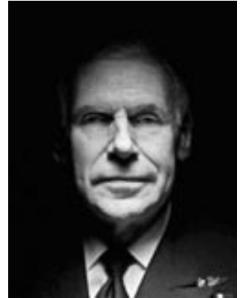
Admiraal William J. Fallon

De melding was toegevoegd op aandringen van de CIA, aldus een voormalige hoge functionaris van de veiligheidsdienst. De geheime operaties beschreven in de Finding komen grotendeels overeen met de geheime militaire strijdkracht die nu in Iran opereert, onder de leiding van JSOC. Volgens de uitleg van de wet van de regering van Bush hoeven clandestien militaire activiteiten, in tegenstelling tot CIA operaties, niet in de Finding te worden omschreven, omdat de president het grondwettelijke recht heeft strijdkrachten in het veld opdrachten te geven zonder bemoeienis van het congres. Maar de grenzen tussen operaties zijn niet altijd duidelijk: in Iran hebben CIA-agenten en regionale aanwinsten de taalvaardigheden en lokale kennis om contacten te leggen voor de JSOC-plannen, en werken ze samen om personeel, materieel en geld naar Iran te dirigeren vanuit een obscure basis in het westen van Afghanistan. Hierdoor heeft het congres slechts een gedeeltelijk overzicht over hoe het toegezegde geld wordt gebruikt. Een van de missies van de speciale eenheid van