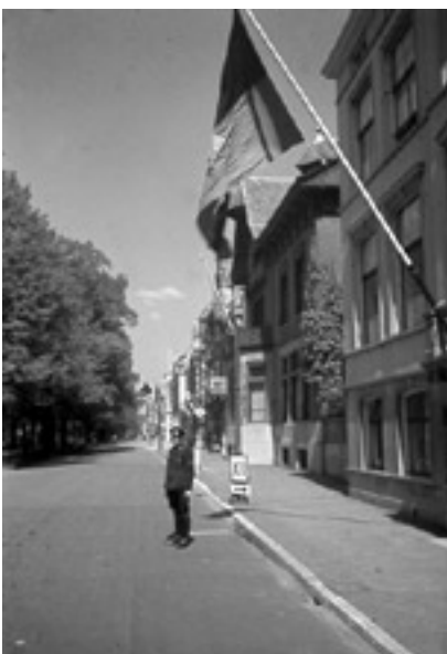
Hoofdkwartier van de NSB