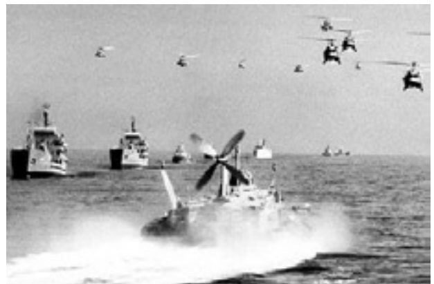
Vrij recente Iraanse oefening in de straat van Hormuz

1 Die Wochenzeitung WOZ werd in 1981 opgericht. Het is een progressieve krant die in Zwitserland verschijnt met een oplage van 14.000 exemplaren en een lezersbereik van meer dan 200.000. De krant is onafhankelijk van partijpolitiek en is geen onderdeel van een mediaconcern. Hij maakt gebruik van kritische journalistiek en levert interessante achtergrondinformatie.