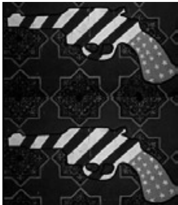
Een muurschildering op de muur van de voormalige Amerikaanse Ambassade in Teheran, onder de Iraniërs nu bekend als 'het spionnenhol'.

Volgens de wet dient een 'Presidential Finding', die strikt geheim is, te worden uitgeschreven als een geheime veiligheidsoperatie die op het punt staat uitgevoerd te worden en dient op z'n minst bekend gemaakt te worden aan de leiders van de Democratische en de Republikeinse partij